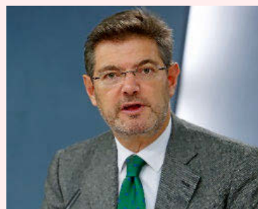
Rafael Catalá, miembro del consejo asesor de Herbert Smith Freehills.